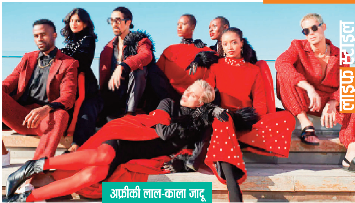
अफ्रीकी लाल-काला जादू

अफ्रीकन फैशन इंटरनेशनल (एफआई) फैशन की दुनिया में गुणवत्ता, किफायती और प्रामाणिक अफ्रीकी डिजाइनर ड्रेस उपलब्ध कराता है। 2007 से शुरू हुई इस पहल ने वैश्विक फैशन उद्योग में विविधता की कमी को पूरा किया है। हाल ही में एफआई में लाल और काले रंग के सम्मिश्रण के साथ मॉडल को पेश किया।